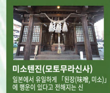
미스텐진(모투무라신사) 일본에서 유일하게 「원장(味噌, 미소)」에 행운이 있다고 전해지는 신