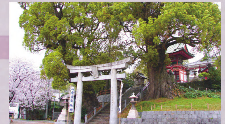
4 「기온바시」에서 하차, 도보로 약 5분