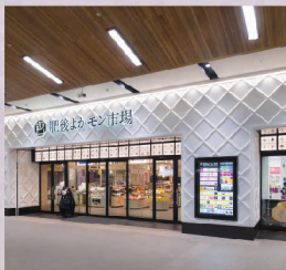
3 「구마모토역」에서 하차, 도보로 바로 앞 구마모토역 熊本駅

2021년 4월에 오픈한 「아뮤플라자 구마모토(アミュプラザ熊本)」에는 「유니클로」「GU」등이, 또 JR구마모토 시라카와 빌딩에는 「빅 카메라」 등의 인기있는 점포가 다수 입점했습니다. 또한 역내에 위치한 「히고 요카몬시장(肥後よかもん市場)」에서는 해산물과 라멘 등 구마모토 특유의 맛을 즐길 수 있는 식당을 시작으로 카페, 햄버거 체인점 등이 이어진 레스토랑 코너 외에도 구마모토의 좋은 술과 고급 과자 등을 구입할 수 있는 특산품 가게가 줄지어 있습니다.