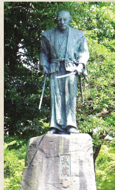
미야모토 무사시 동상

미야모토 무사시는 그의 생애에서 한번도 진 적이 없는 검객이라고 합니다. 50대에 당시의 번주였던 호소카와 다다토시의 부름을 받고 구마모토에 살기 시작한 무사시는 키포잔 산의 「레이간도 동굴(靈巖洞)」에서 은둔하며 병법서 「오륜서(五輪書)」를 쓰기도 했습니다. 글과 그림에도 뛰어나 그가 남긴 작품은 지금도 높은 평가를 받고 있습니다.