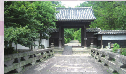
4 「기온바시」에서 하차, 도보로 약 10분