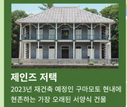
제인즈 저택 2023년 재건축 예정인 구마모토 현내에 현존하는 가장 오래된 서양식 건물