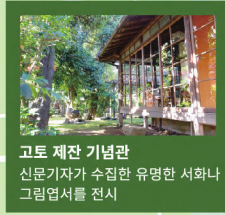
고토 제잔 기념관 신문기자가 수집한 유명한 서하나 그림엽서를 전시