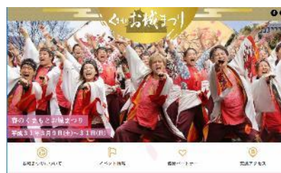
◆くまもとお城まつりHP