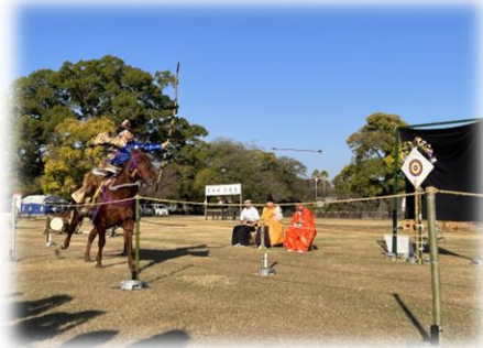
【秋のくまもとお城まつり】