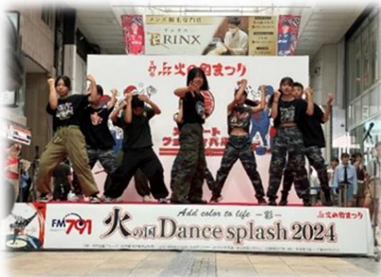
【アーケードイベント】