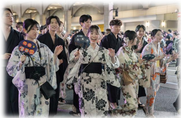
【おてもやん総おどり】