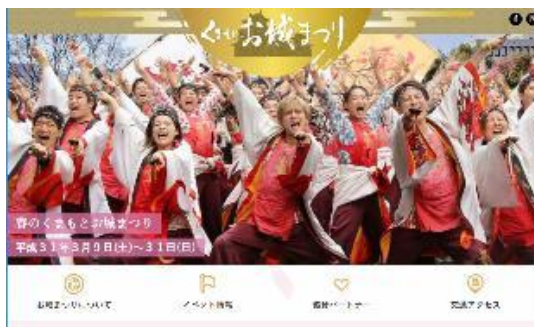
◆くまもとお城まつりHP