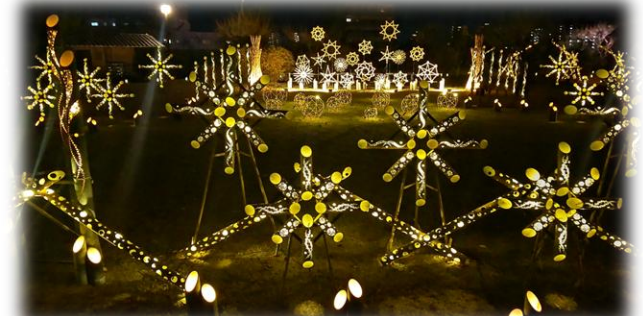
【春のくまもとお城まつり】