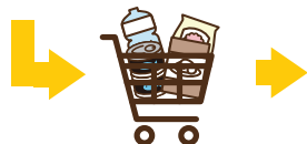
食べ物や日用品を多めに買う