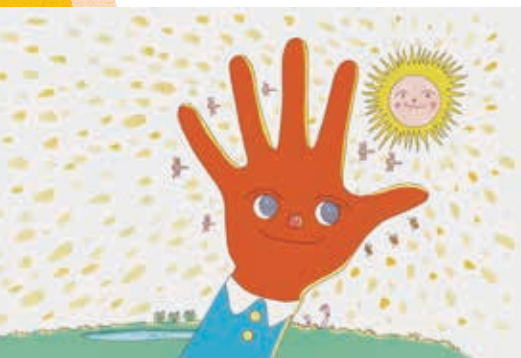
1.「てのひらを太陽に」制作年不明/2.「詩とメルヘン」1978年8月号表紙絵「ついにぼくは夜明けの光の矢をにぎったぞ」 ©やなせたかし (公財)やなせたかし記念館アンパンマンミュージアム振興財団蔵